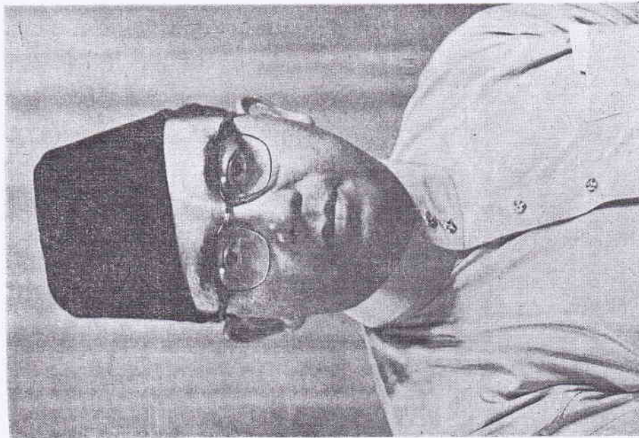
Y.A.B. TUN ABDUL RAZAK BIN HUSSAIN AL-HAJ Timbalan Perdana Menteri.