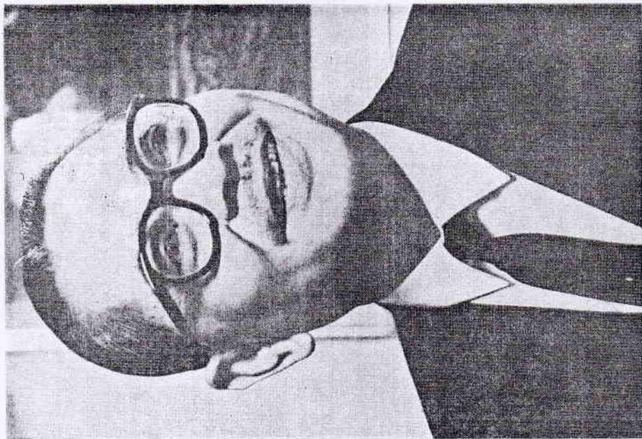
Y.T.M. TUNKU ABDUL RAHMAN PUTRA AL-HAJ Perdana Menteri.