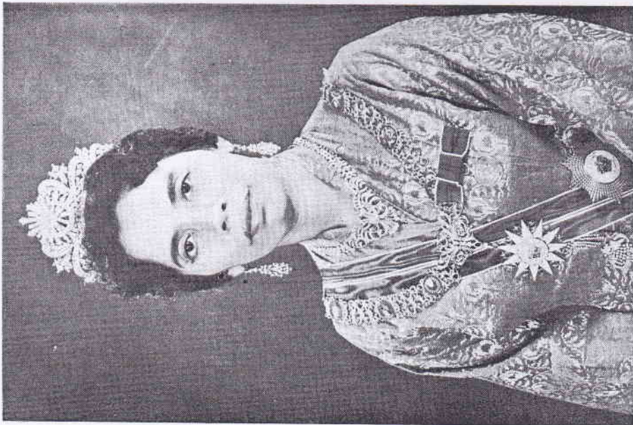
DULI YANG MAHA MULIA SERI PADUKA BAGINDA RAJA PERMAISURI AGONG